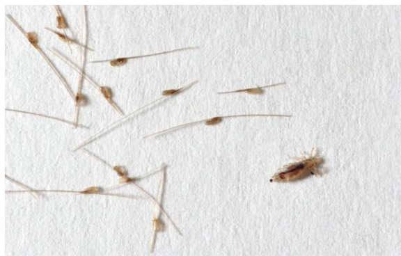
Wesz głowowa i gnidy

Jeśli zauważmy gnidy na włosach znajdujących się ponad centymetr od skóry głowy, świadczy to o „starym zakażeniu”.